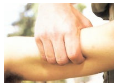
נקודת לחיצה בזרוע