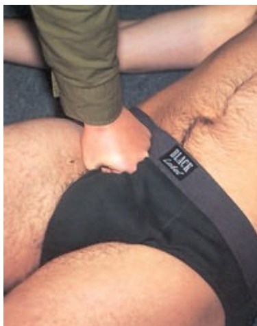
נקודת לחיצה במפשעה